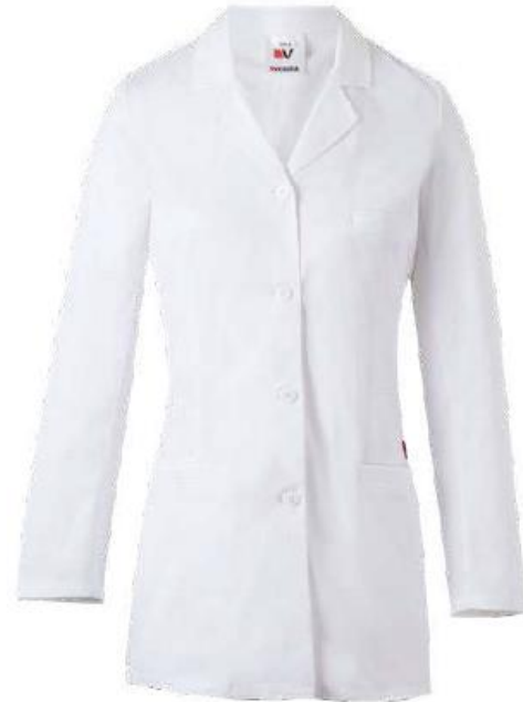
Blouse stretch femme CBST274