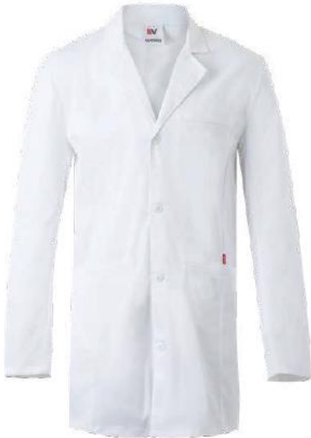
Blouse stretch homme CBST273