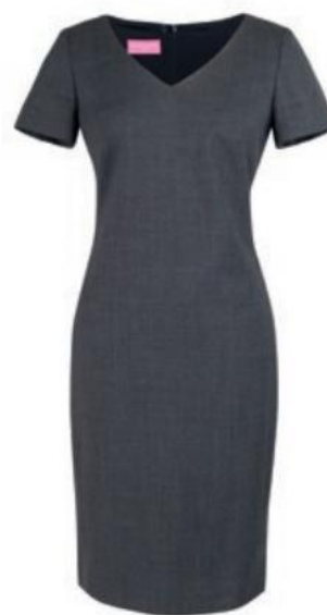
ROBE CORINTHIA G. Gris moyen 2246