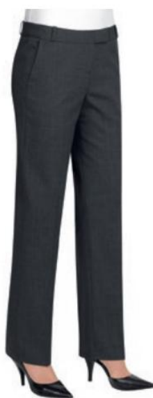
PANTALON ASTORIA JAMBE AJUSTÉE 2262