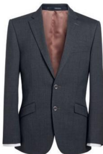
ALDWYCH - Coupe sur mesure 3125