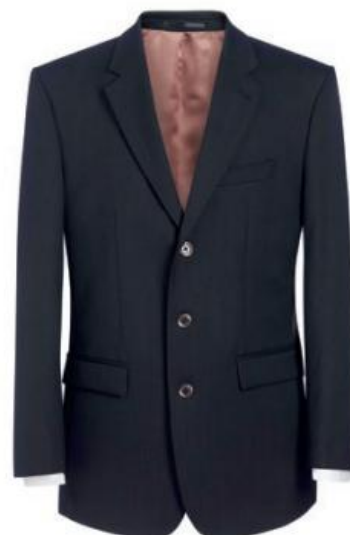
LANGHAM - Tailored Fit 5984