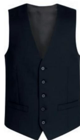
PANTALON HOLBECK SLIM FIT