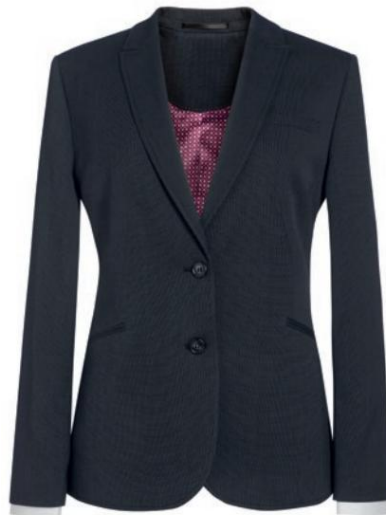
CORDELIA - Coupe ajustée CUB41004