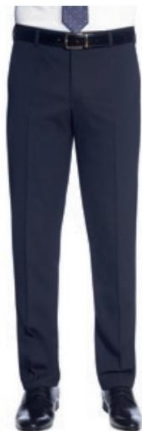
PANTALON HOLBECK SLIM FIT 8733