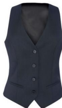
WALDORF - Coupe sur mesure 2200