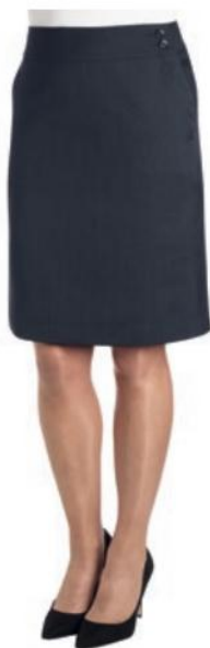
JUPE MARCHANDE LIGNE A, POCHE LATÉRALES 2352