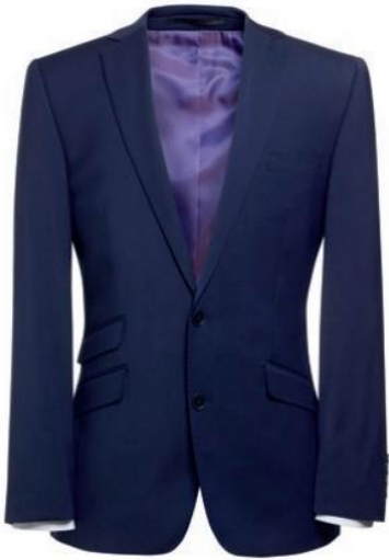
CASSINO - Coupe Slim 5985