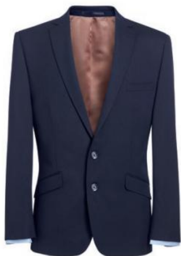
HOLBECK - Coupe ajustée 3500