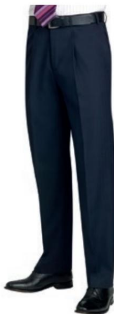
PANTALON LANGHAM COUPE CLASSIQUE 8525