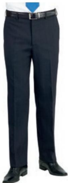
PANTALON ALDWYCH COUPE SUR MESURE 8557