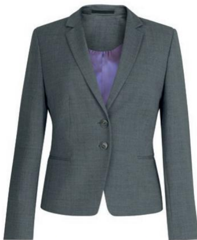
CALVI - Coupe Slim 2252