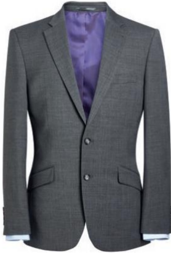
AVALINO - Coupe ajustée 5647