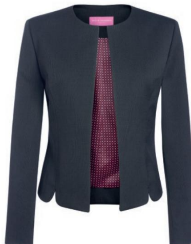
VEGA - Coupe sur mesure CUB41.007