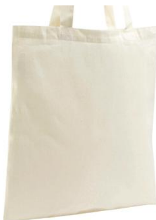
Zen Eco CAC385

Sac écoresponsable Toile 115 100% coton issu de l'agriculture biologique Dimensions - 37 x 42 cm