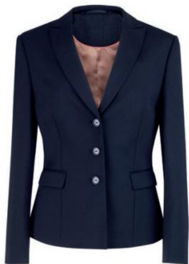
RITZ - Coupe sur mesure 2227