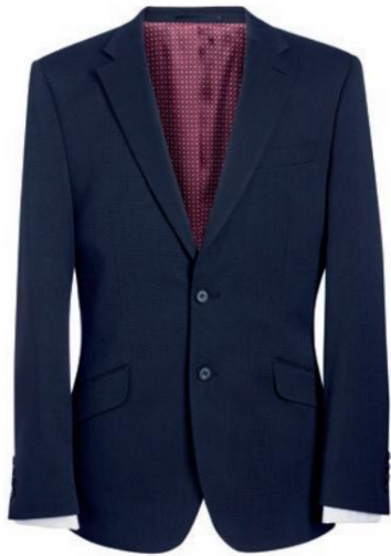
PEGASUS - Coupe ajustée CUB41001