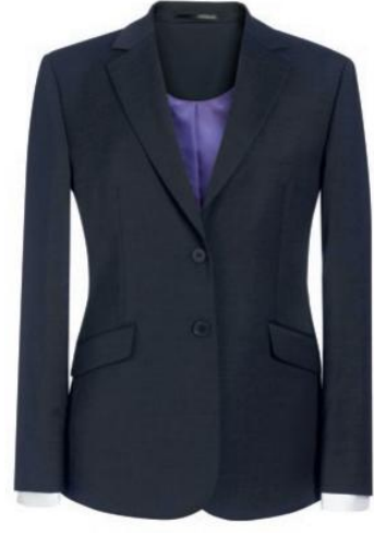
OPERA - Coupe classique 2250