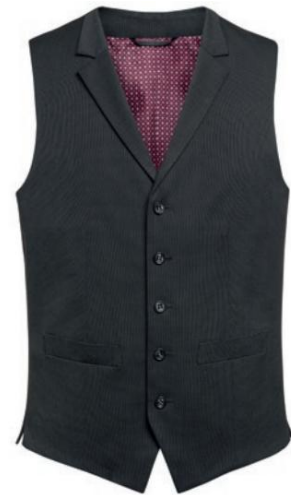
PROTEUS - Coupe sur mesure CUB41005