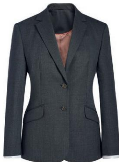
CONNAUGHT - Coupe classique 2226