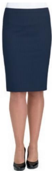
JUPE WYNDHAM DROITE 2229