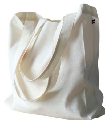
Tristan Carry CAC386

Sac Made in France Cretonne 150 Tissé et fabriqué en France - Tissu 100% coton issu de l'agriculture biologique Dimensions - 39 x 42 cm