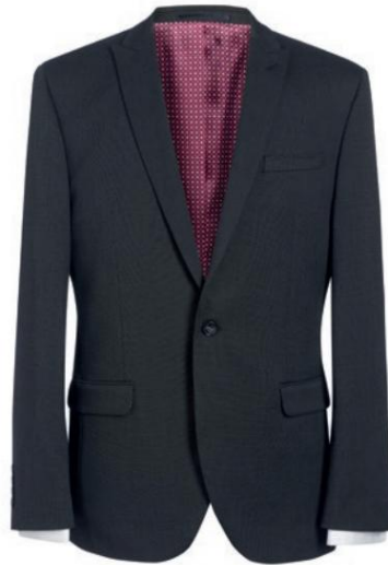
PHOENIX - Coupe ajustée CUB41003