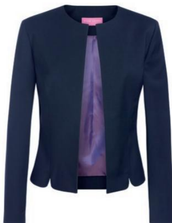
ROSA - Coupe sur mesure 2353