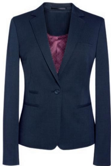
ARIEL - Coupe Slim CUB41002