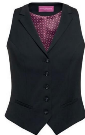
LARISSA - Coupe sur mesure CUB41006