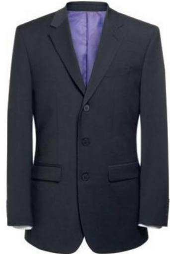
IMOLA - Coupe Classique 5646