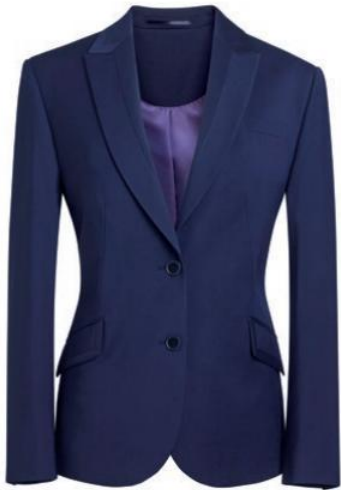
NOVARA - Coupe sur mesure 2222